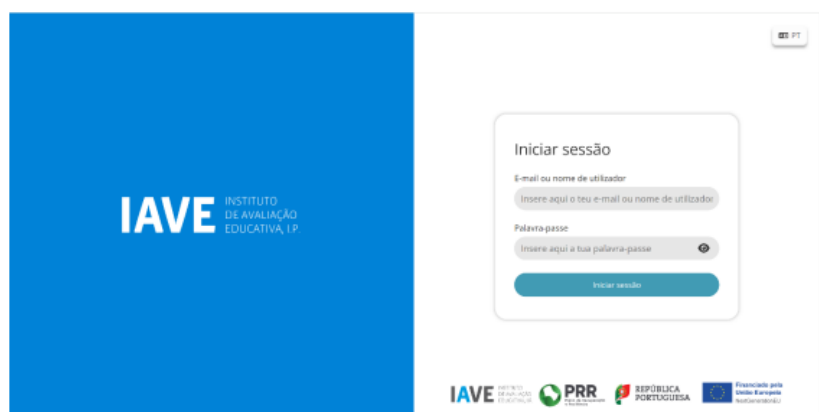
Figura 1 – Acesso à Plataforma de Realização de Provas do IAVE

c) Inserir as credenciais “Nome de utilizador” e “Palavra-passe” e, em seguida, clicar em “Aceder” ou “Iniciar sessão”.